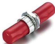
Código 100040497416 100040497419