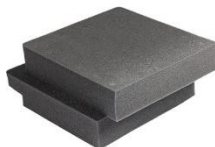
Sección de espuma No PNP 2 pcs. híbrida 1535HFS