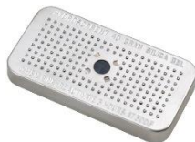
Desecante Silica Gel 1500D