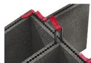
TrekPak™ Divisores 1535TP-KIT