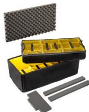
Set Padded Divider 1626AirDS