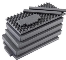
Juego espuma pre cortada Pick N Pluck™ (PNP) 8 pcs. 1626AirFS