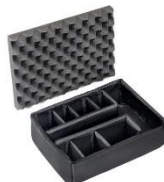
Padded Divider 1455