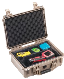
Base con Padded Divider