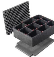
Kit TrekPak™ Divider 1450TPKIT