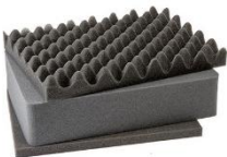
Juego espuma pre cortada Pick N Pluck™ (PNP) 3 pcs. 1451 PNP