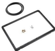
Panel Frame 1450PF