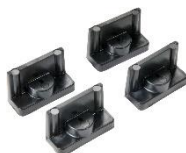
Escuadras para montaje (Complemento para Panel Frame) 1507