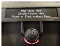
Placa Personalizada 1403PG