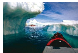
Resistencia a climas extremos