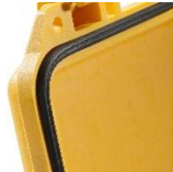
O'ring de tapa 1453