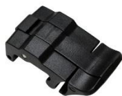
Cerrojos en todos los colores 1553-942