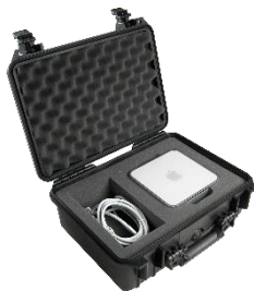
Base con PNP™