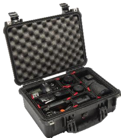
Base con Trekpak™