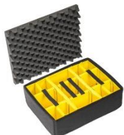
Set Padded Divider 1555