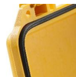
O'ring de tapa 1553