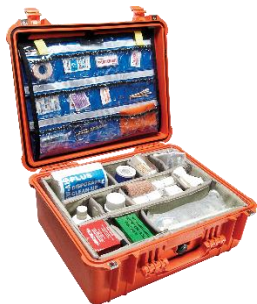
Protector EMS (Botiquín) 1550EMS