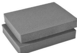
Sección de espuma pre cortada Pick N Pluck™ (PNP) 2 pcs. 1552 PNP