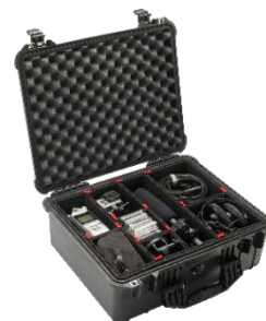
Base con TrekPak™