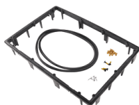
Panel Frame 1550PF