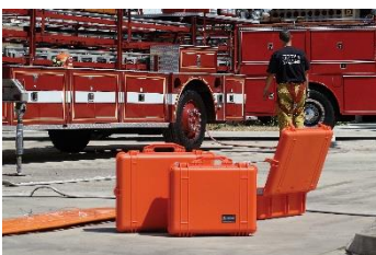
Uso Cuerpo de Bomberos