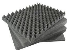
Juego espuma pre cortada Pick N Pluck™ (PNP) 4 pcs. 1551 PNP