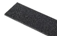
TrekPak™ Divider Adicional 1510TPDIV