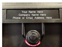
Placa Personalizada 1403PG