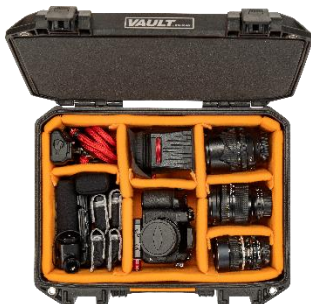
Base Padded Divider para cámara