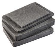
Juego espuma 5 piezas V300FS