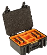
Set con Padded Dividers V300WD